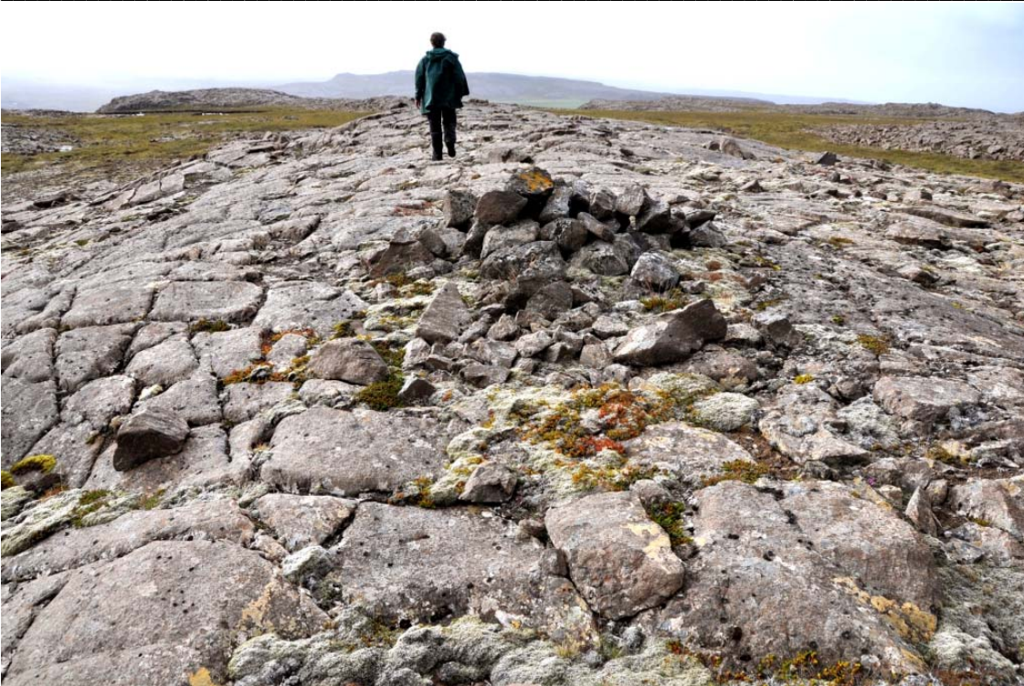
Mynd 9. Á Hólmláturborg.