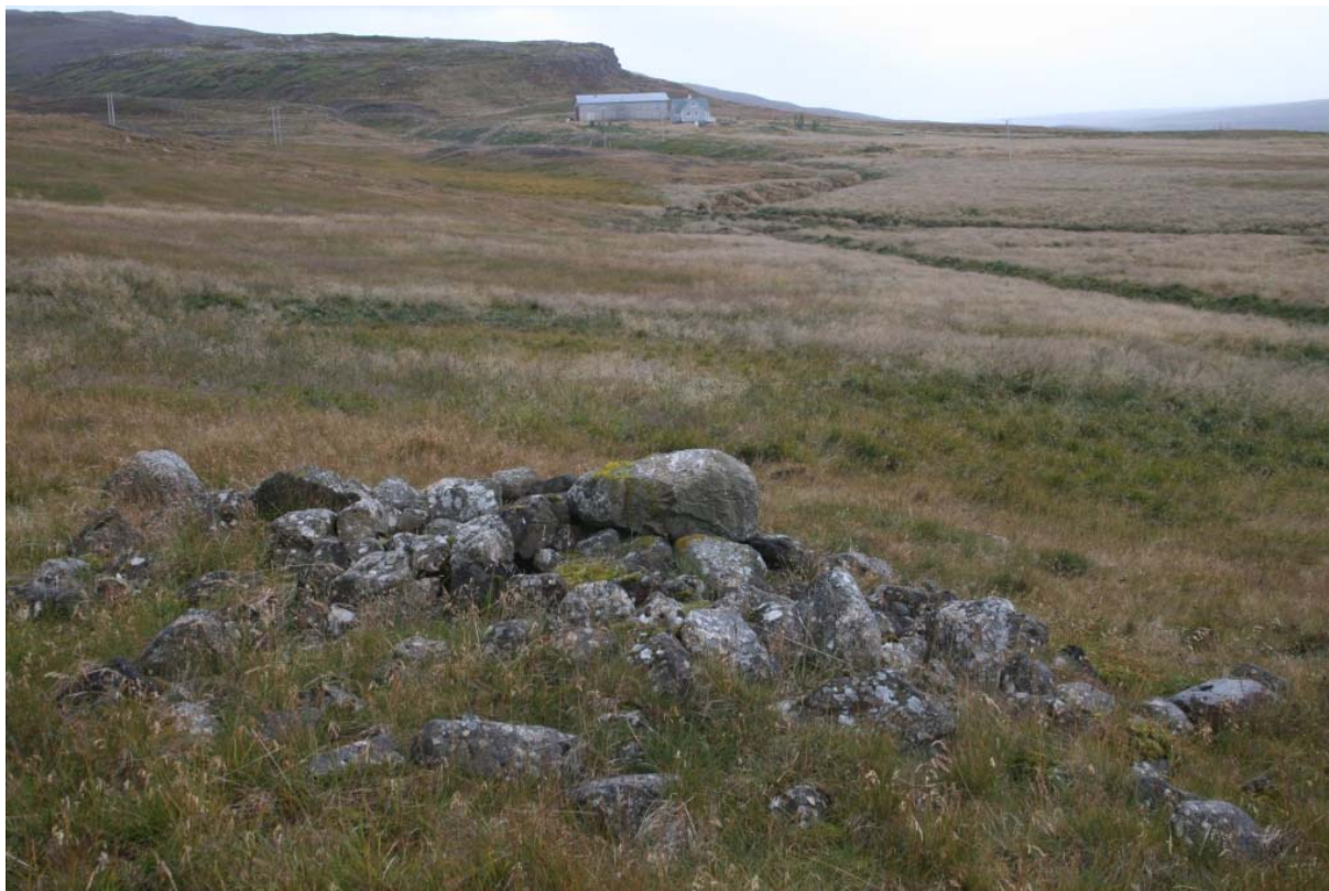
Mynd 3. Dys hjá Setbergi.

aðalvegur sveitarinnar liggur norðar og afleggjarinn inn Stóra-Langadal liggur nú austar. Heimildir: Ö-Ytra-Leiti GS, 1.