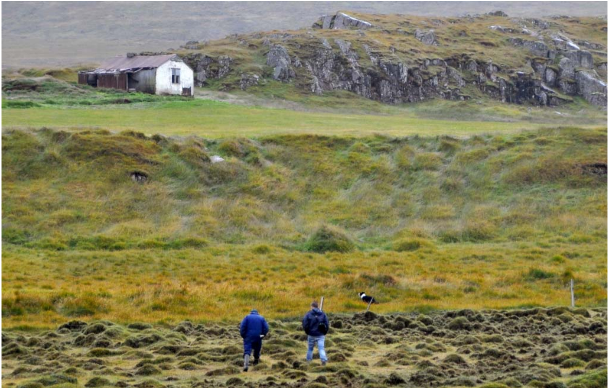
Mynd 007. Bílduleiði er neðst í hvammi niðurundan Bílduhólsbæ.