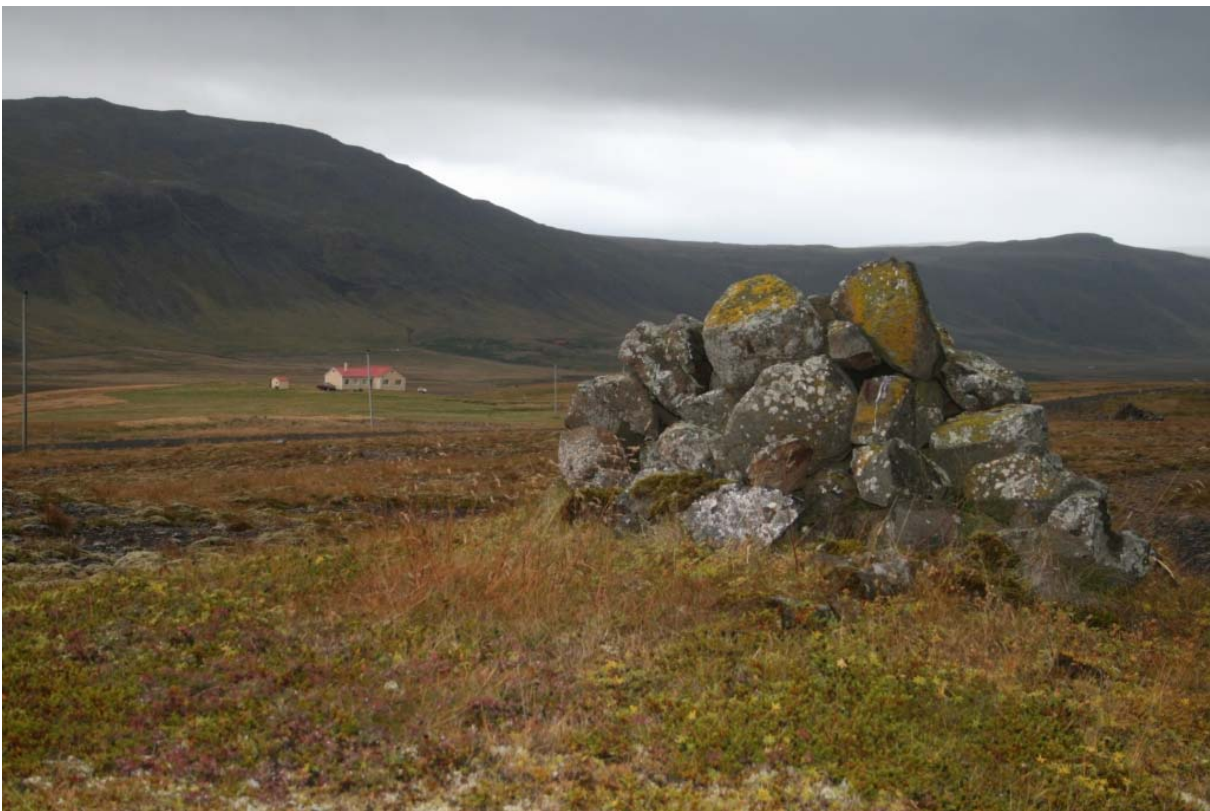
Mynd 2. Dys í Langadal, Ytra-Leiti í fjarska.

Heimildir: Ö-Narfeyri LK,7; Ö-Narfeyri GS, 2.