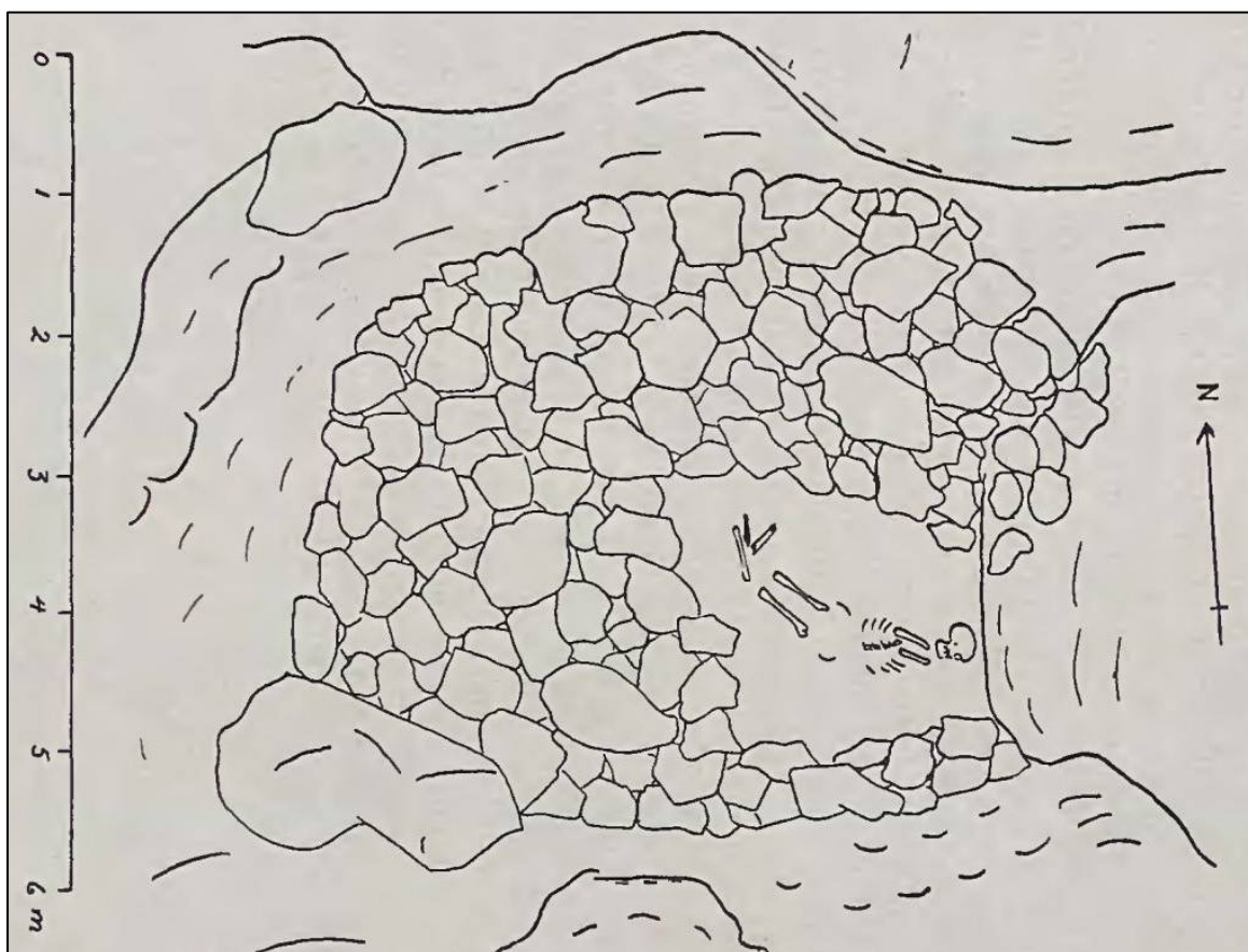
Mynd 8. Dys á Hólmlátri. Teikn. K.E. 1942.

Heimildir: Ö-Hólmlátur GS, 3; Kristján Eldjárn, Árbók HÍF, 52-54.