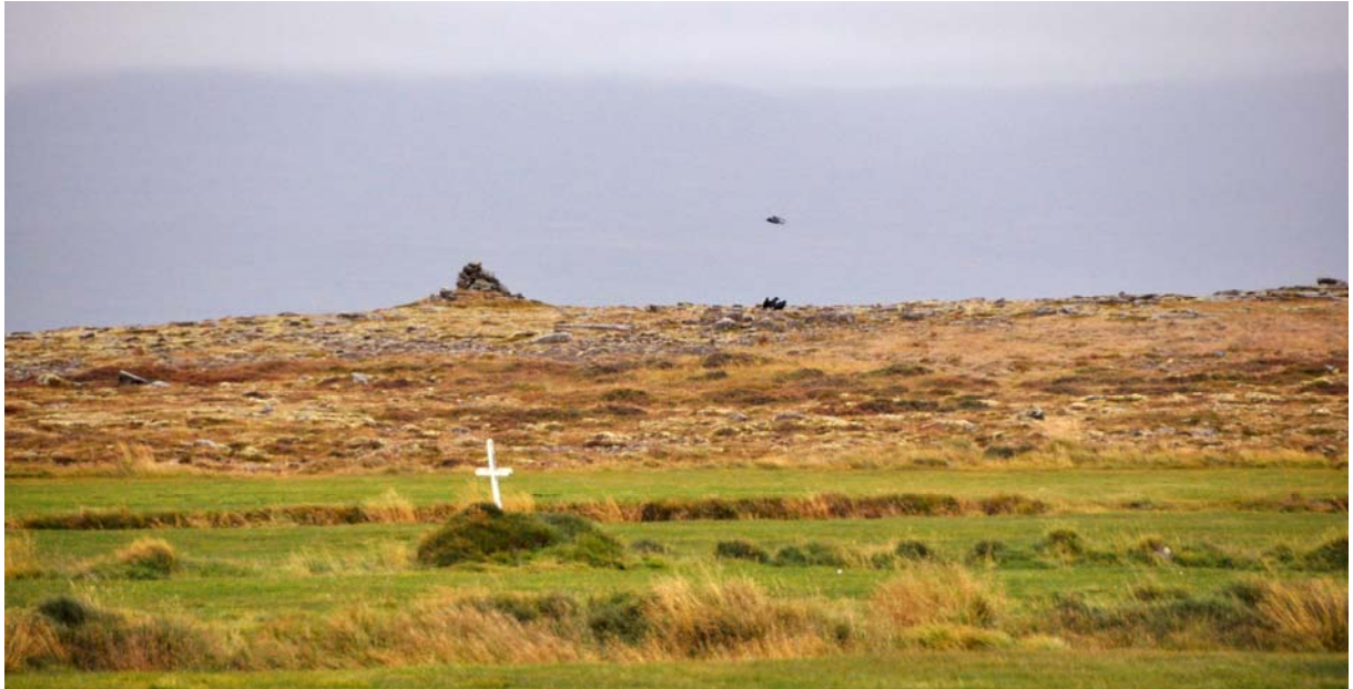
Mynd 5. "Leiði Kolbeins" í túni á Keisbakka. Holtið á Vörðutanga í bakgrunni.