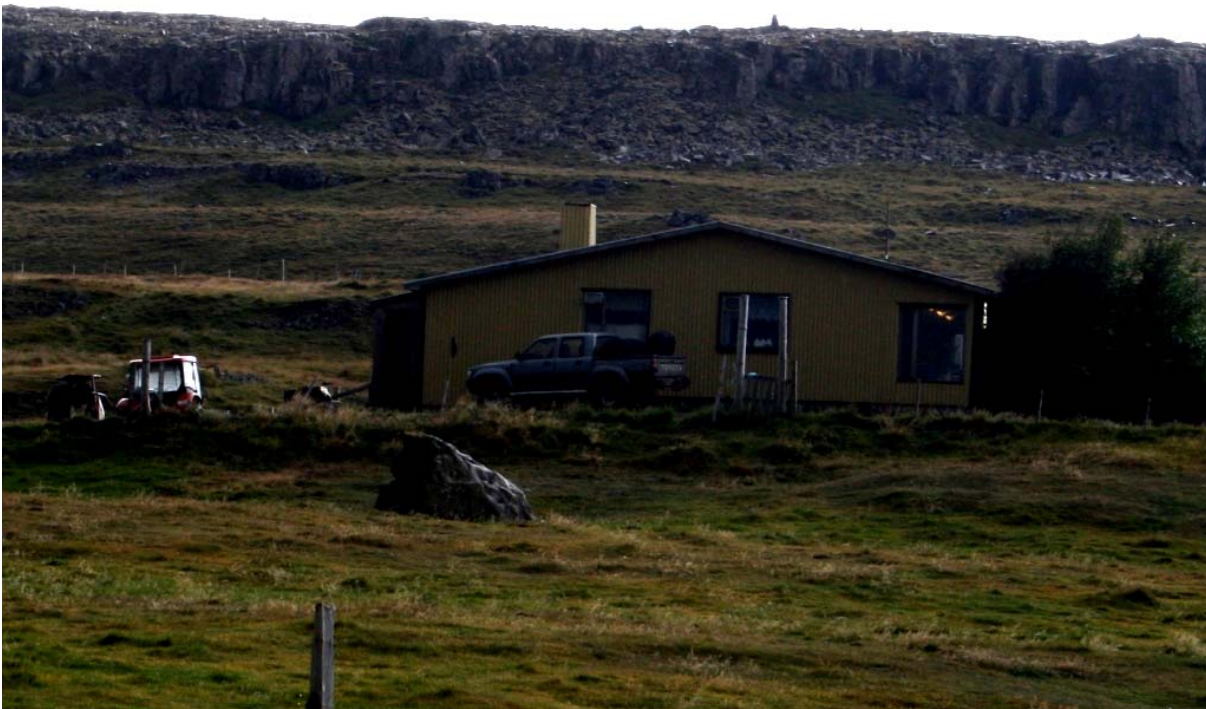
Mynd 008. „Legstaður Emmu“, undir steini framan við bæinn Emmuberg.