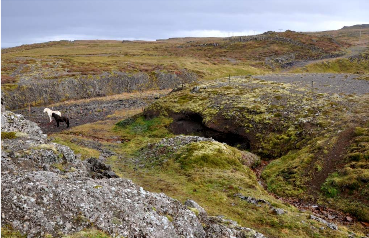
Mynd 006. Dys í Dysflóa í landi Bílduhóls.