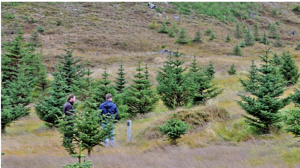
Mynd 4. Hafþórsleiði.

Heimildir: Sýslu og sóknalýsingar HÍB: Snæfellsnes III, 220.