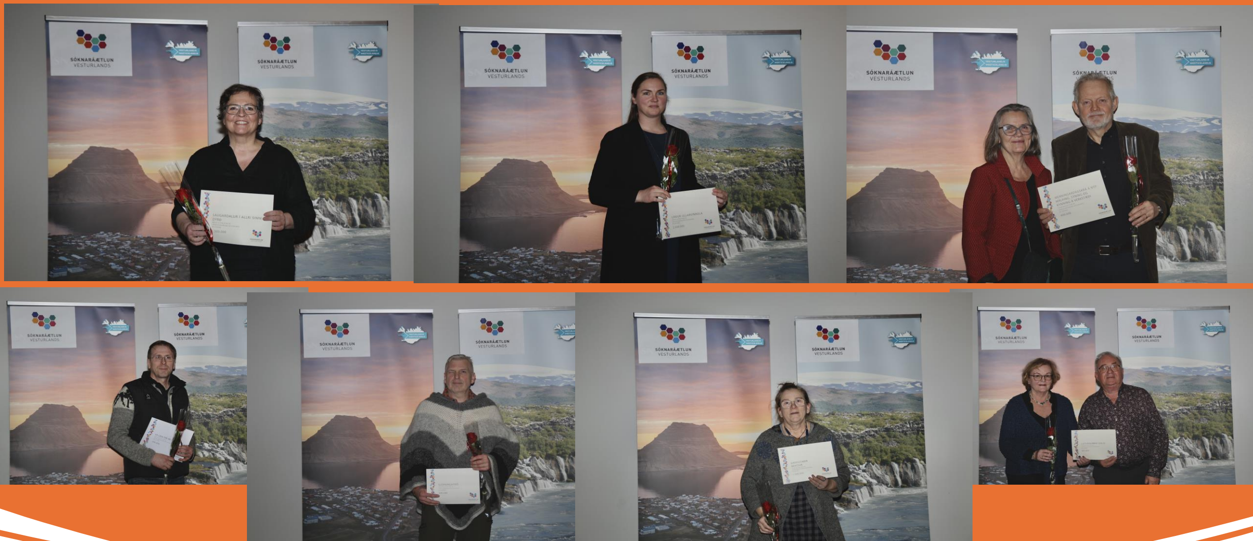
Glæsilegir fulltrúar Dalamanna við verðlaunaafhendingu Uppbyggingarsjóðs Vesturlands