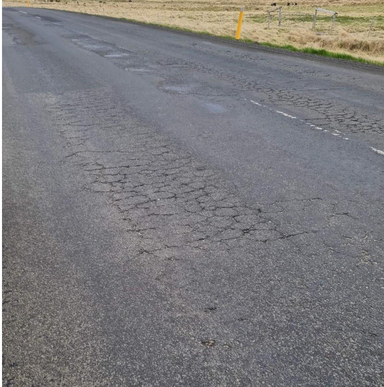
Slitlag við Brautarholt rétt áður en komið er að Haukadalsá á Vestfjarðarvegi 60

Þá er það stefna stjórnvalda að reyna dreifa ferðamönnum um landið til að minnka álag og halda gæðum í upplifun þeirra. Góðar samgöngur eru lykilatriði í þessum málum, sem og forsenda þess að hægt sé að halda ferðaþjónustu uppi sem atvinnuvegi árið um kring. Með tilliti til þessa er mikilvægt að horfa til þeirra vega, þar sem er að finna verkefni á áfangastaðaáætlun, um leið og uppbygging ferðaþjónustu í héraðinu í heild var höfð til hliðsjónar.