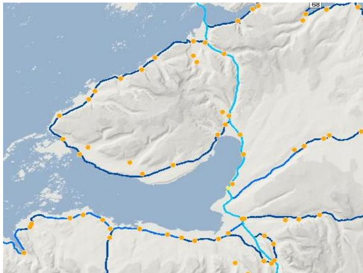
Skjáskot af kortaþekju Vegagerðarinnar þar sem m.a. eru birtar upplýsingar um einbreiðar brýr.

Þá er einnig bent á að einbreiðar brýr eru oft farartálmi að vetri þegar snjóþyngsli hamla umferð, oftar en ekki eru þær eini staðurinn á vegkafla sem getur talist ófær. Er þetta sérstaklega mikilvæg með tilliti til varaleiða umferðar líkt og Laxárdalsheiðar og eins á þeim svæðum þar sem íbúar dreifbýlis sækja vinnu utan heimilis og þurfa að fara um einbreiðar brýr á sinni leið.