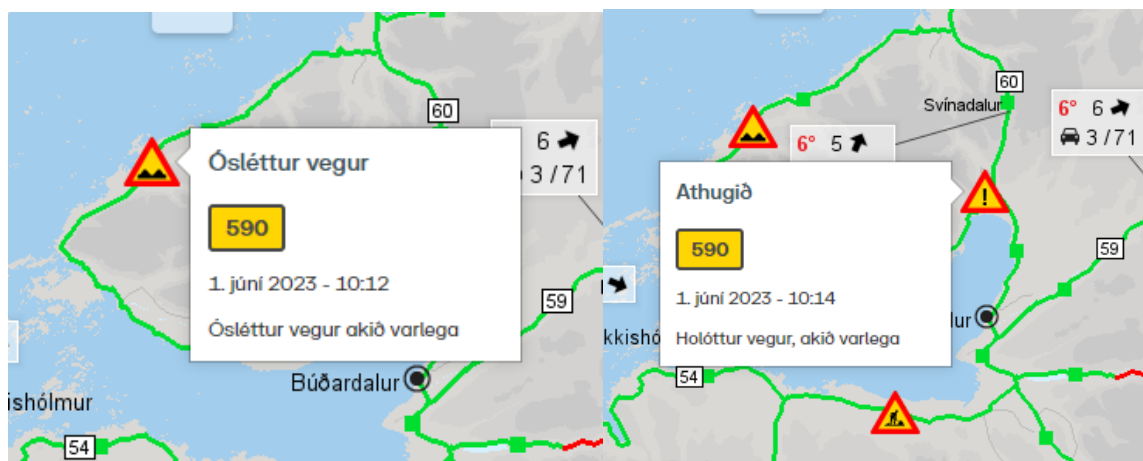
Skráning á vegum 01.06.2023 samkv. vef Vegagerðarinnar á Klofningsvegi

Einnig bendir Dalabyggðar á að þeir vegir sem skólaakstur þarf að nýta eru ekki allir skilgreindir sem vegir sem hafa eftirlit/þjónustu alla daga og hvetur til þess að slík viðmið verði endurskoðuð, í það minnsta svo eftirlit sé reglulegra yfir virka daga.