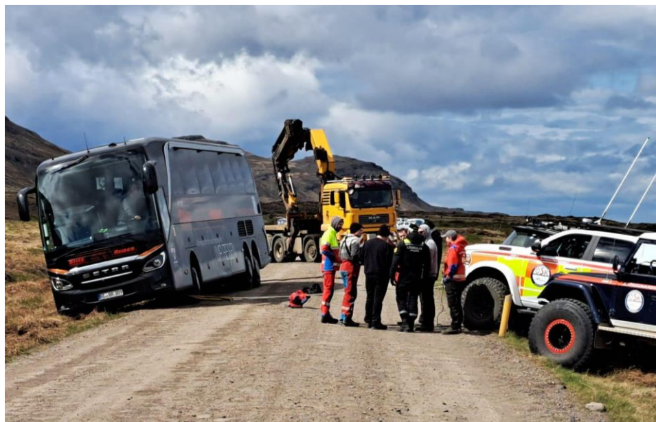
Frá umferðaróhappi á Snæfellsnesvegi (Skógarstrandarvegi), 04.06.2023

Ár hvert gefur Vegagerðin út umferðartölur fyrir mest allt þjóðvegakerfið, þó yfirleitt ekki á héraðsvegum. Þessar umferðartölur eru gefnar upp sem meðaltöl fyrir ákveðna lengd innan hvers vegar m.ö.o. hvert meðaltal gildir bara fyrir ákveðna lengd innan hvers vegar, vegkafla eða stall. Þannig er tiltekin árdagsumferð (ÁDU) þ.e. meðalumferð á dag yfir árið, sumardagsumferð (SDU)