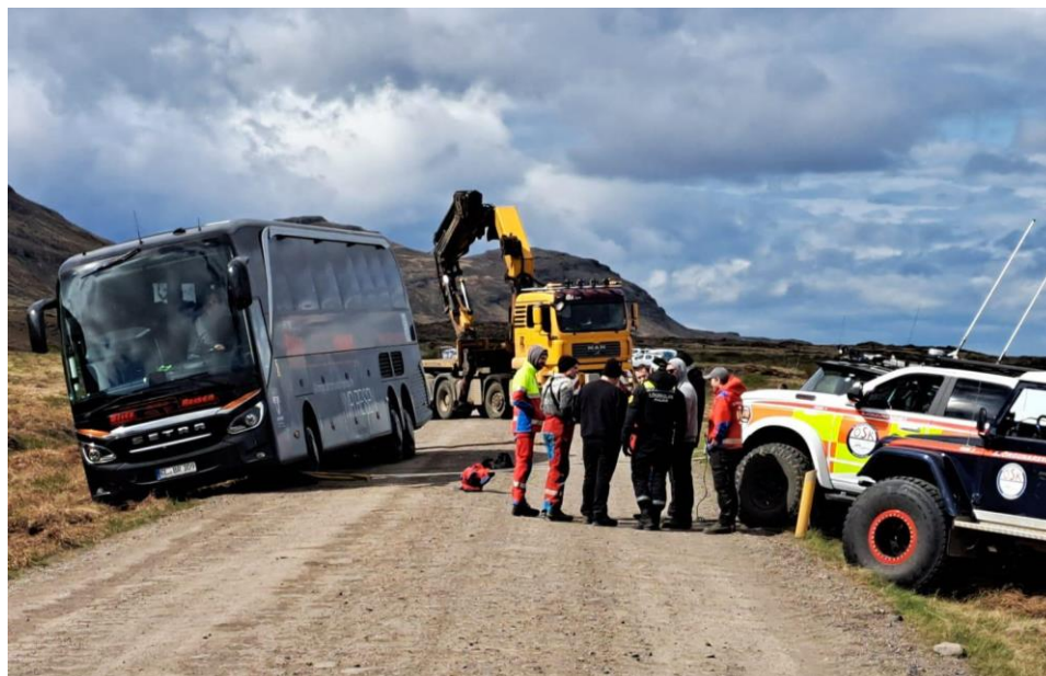
Frá umferðaróhappi á Snæfellsnesvegi (Skógarstrandarvegi), 04.06.2023

Ár hvert gefur Vegagerðin út umferðartölur fyrir mest allt þjóðvegakerfið, þó yfirleitt ekki á héraðsvegum. Þessar umferðartölur eru gefnar upp sem meðaltöl fyrir ákveðna lengd innan hvers vegar m.ö.o. hvert meðaltal gildir bara fyrir ákveðna lengd innan hvers vegar, vegkafla eða stall. Þannig er tiltekin árdagsumferð (ÁDU) þ.e. meðalumferð á dag yfir árið, sumardagsumferð (SDU)