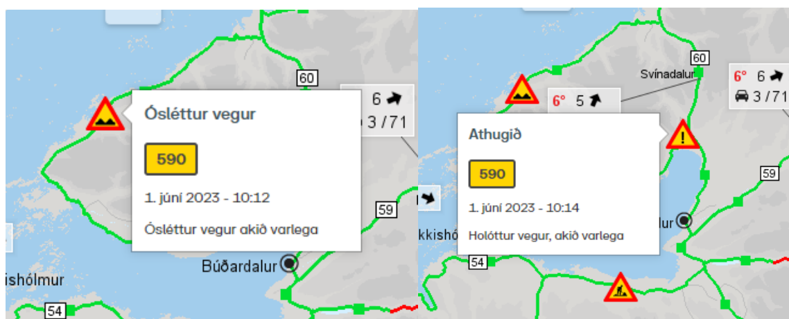
Skráning á vegum 01.06.2023 samkv. vef Vegagerðarinnar á Klofningsvegi

Einnig bendir atvinnumálanefnd Dalabyggðar á að þeir vegir sem skólaakstur þarf að nýta eru ekki allir skilgreindir sem vegir sem hafa eftirlit/þjónustu alla daga og hvetur til þess að slík viðmið verði endurskoðuð, í það minnsta svo eftirlit sé reglulegra yfir virka daga.