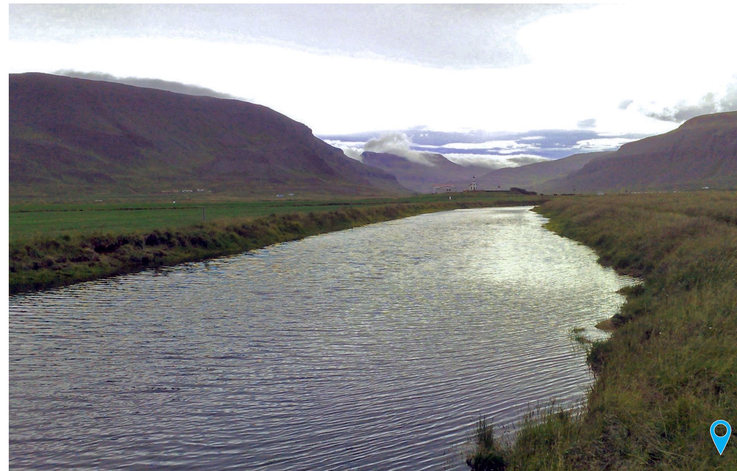
Flæðilækur horft til suðausturs