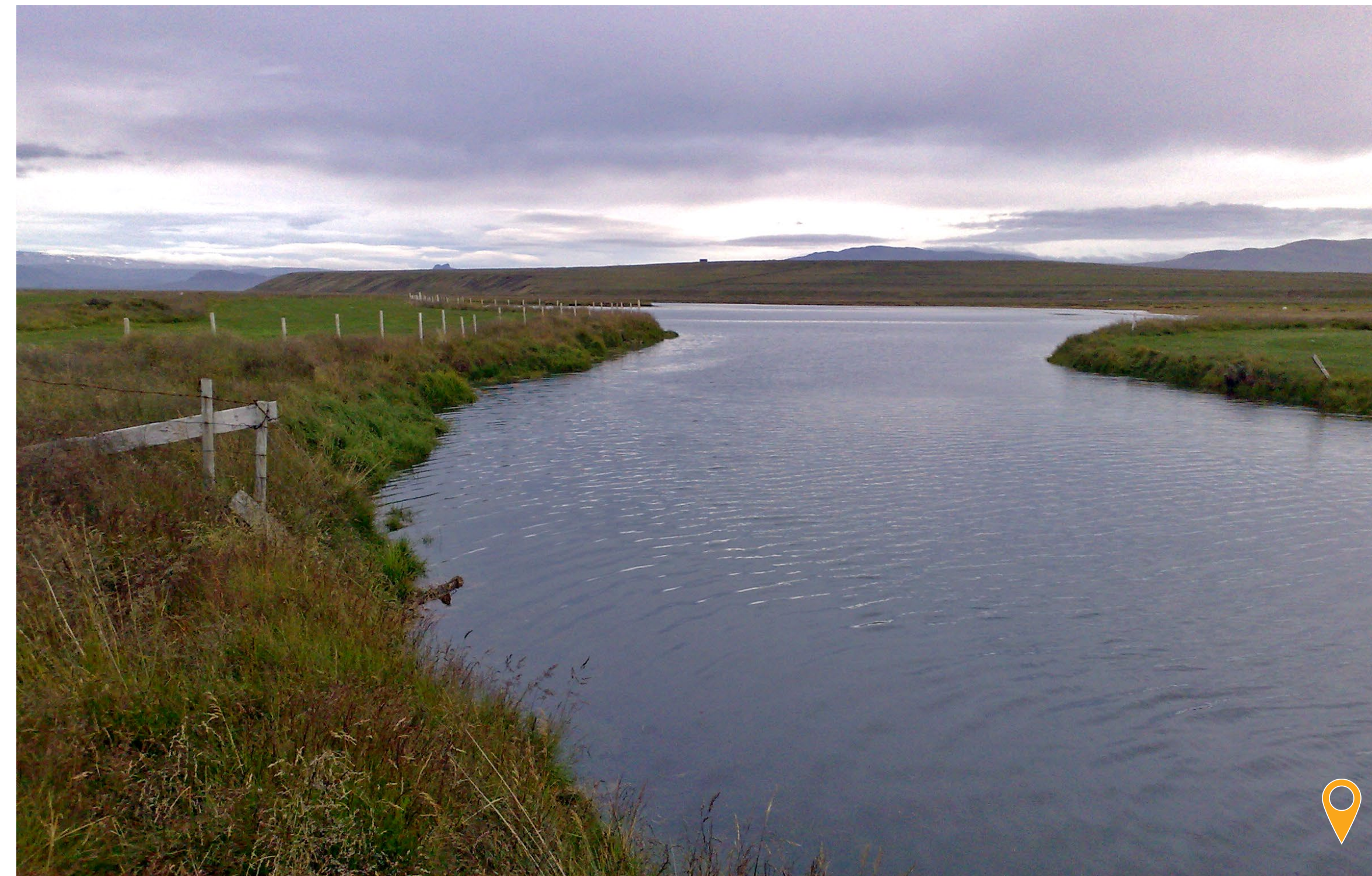
Flæðilækur horft til norðurs