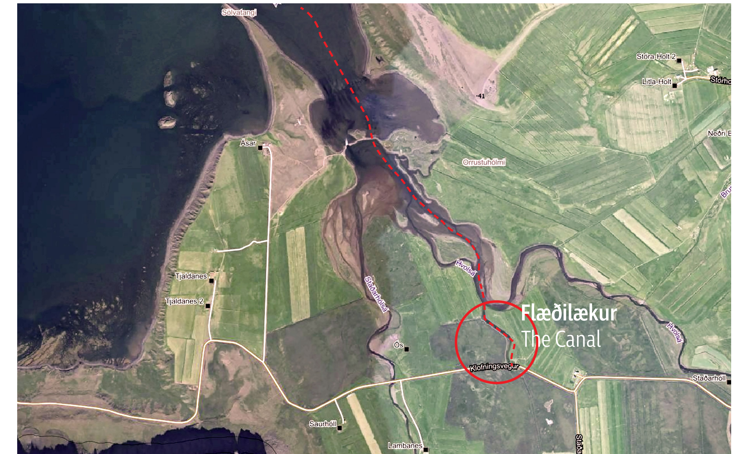
Flæðilækur to south east