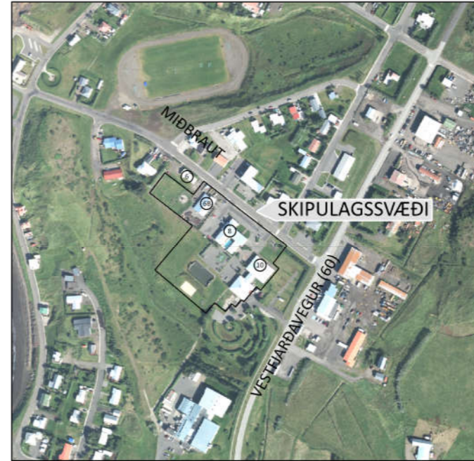
ADALSKIPULAG DALABYGGÐAR 2004-2016. MKV. 1:10.000