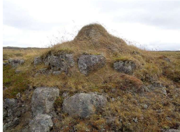
Mynd af vörðu (3120-150)