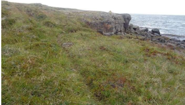
Mynd af Leið (3120-153) og Vörðu (3120-152)

Skráningar 152 og 153 eru á lóðarmörkum, við flæðarmál og utan byggingarreita. Þeim verður ekki raskað. Umhverfis minjarnar er 15 m helgunarsvæði þar sem rask er óheimilt nema með leyfi Minjastofnunar Íslands.