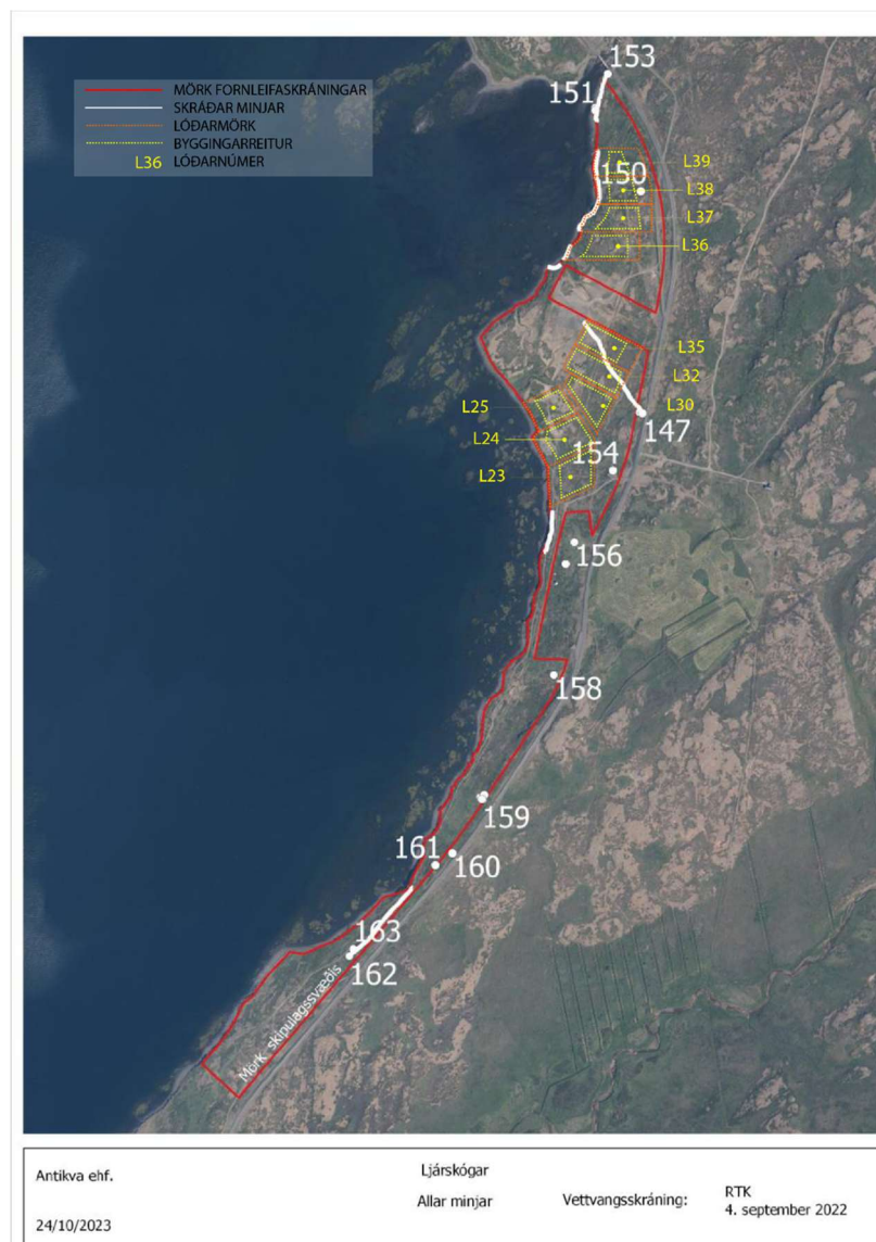
Kort af fornleifaskráningu heildarsvæðis ásamt tillögu að lóðum.