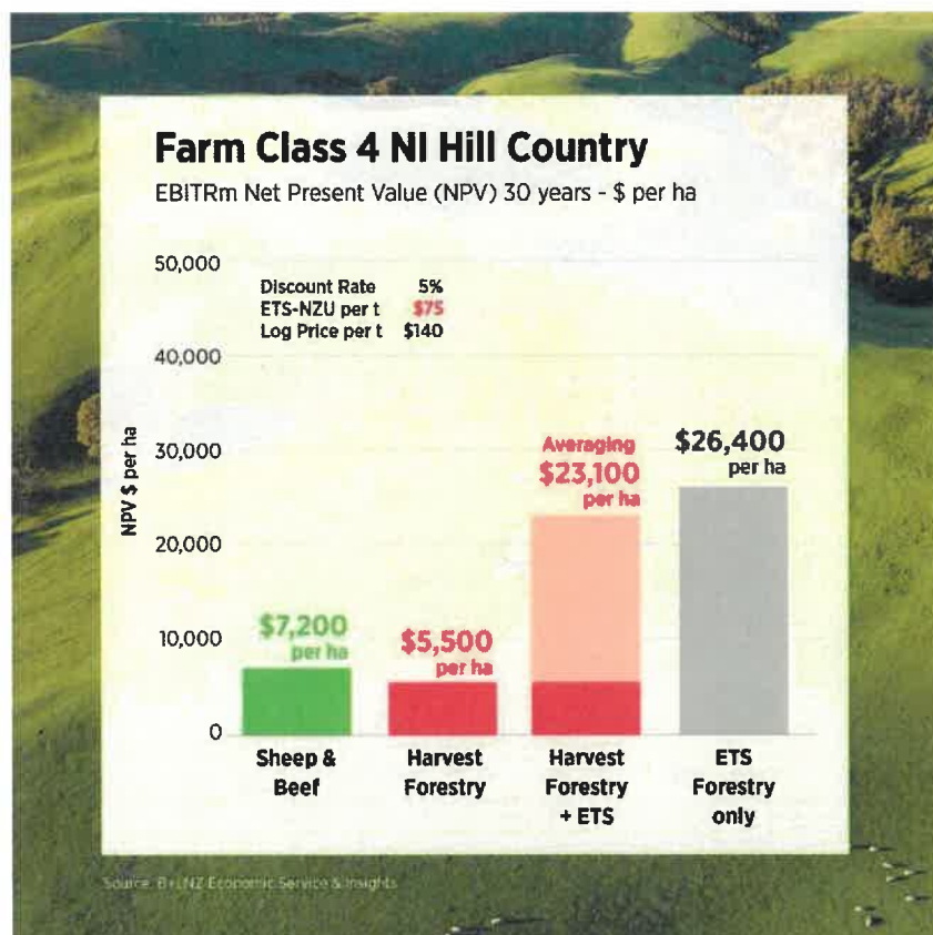
Mynd 1

Þá segir að einn þáttur framtíðarsýnarinnar sé að landnotkun utan þéttbýlis feli í sér vernd góðs landbúnaðarlands og forgang búvöruframleiðslu á góðu ræktunarlandi. Það þurfa að liggja vísindaleg rök fyrir því hvað flokkast sem gott landbúnaðar- og ræktunarland þar sem forsendur eru ekki þær sömu eftir hvernig nýtingu þessa lands er eða gæti verið háttað. Dalabyggð veltir einnig fyrir sér hvernig landbúnaðarstefnan muni taka á forgangi búvöruframleiðslu þegar verð á landnáði er farið að keppa við verð á landi til kolefnisbindingar. Skv. gögnum frá Nýja-Sjálandi er verð á landi til kolefnisbindingar hærra en verð á landi til matvælaframleiðslu ( sjá mynd 1 ) og það er landbúnaður og hin hefðbundna búvöruframleiðsla að fara keppa við. Í verðmyndun jarða á Íslandi er sambærileg þróun byrjuð að sjást.