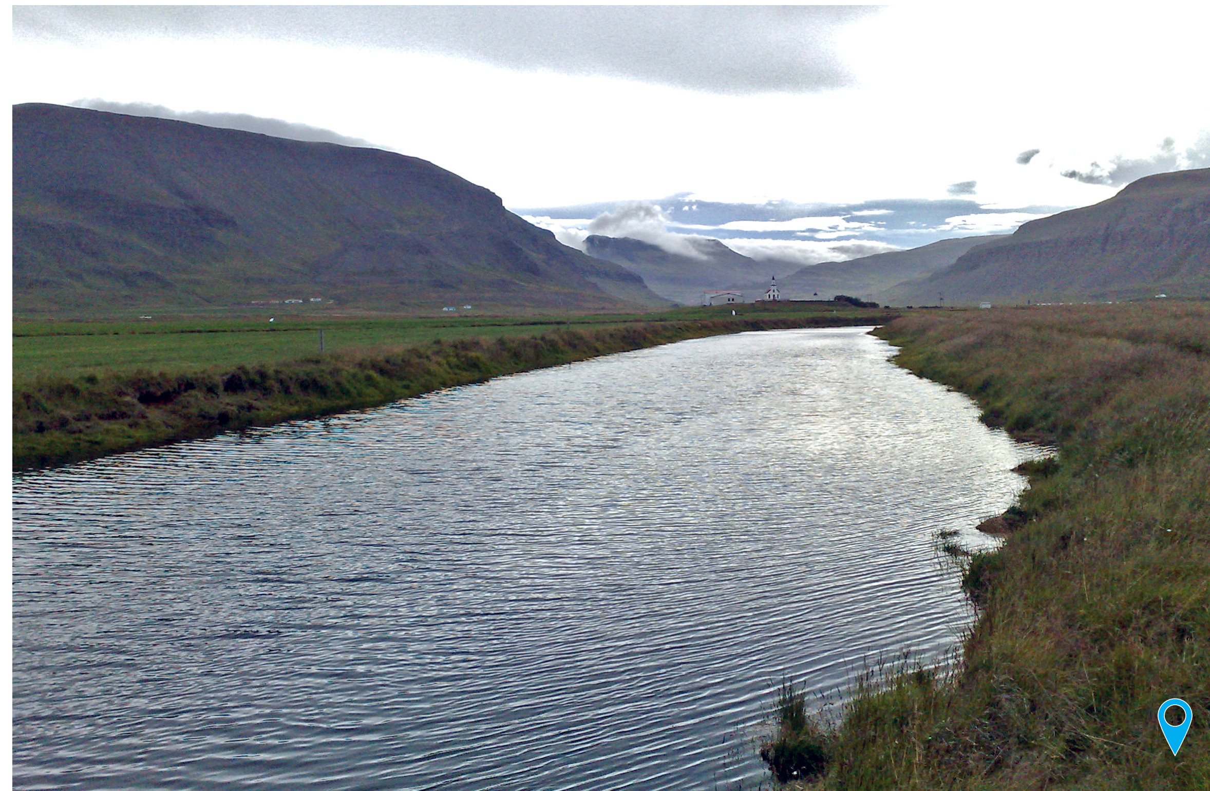
Flæðilækur horft til suðausturs