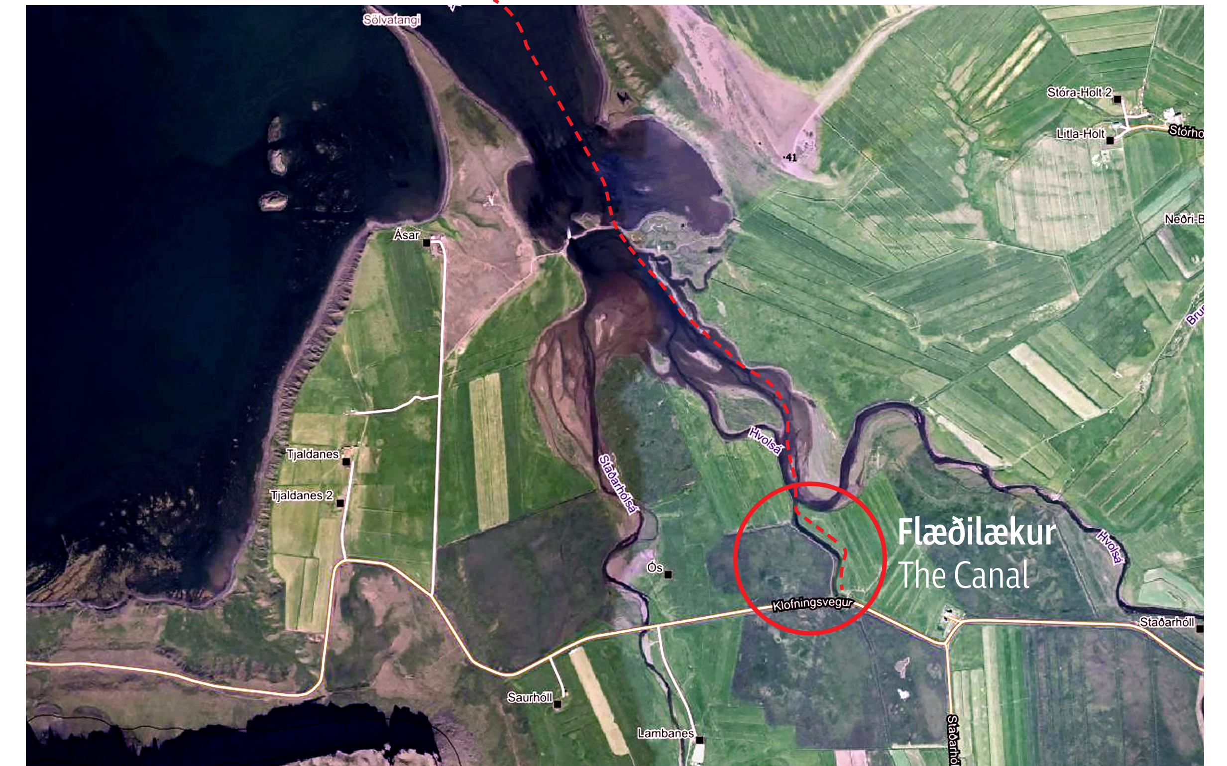
Flæðilækur to south east