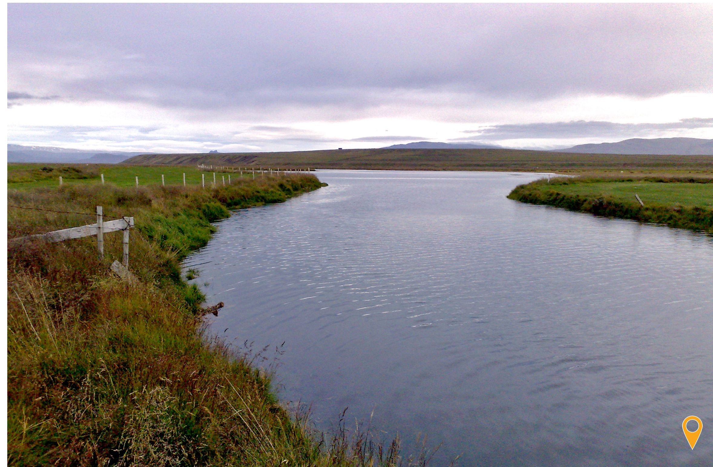
Flæðilækur horft til norðurs

In 1901, a road was made over Staðarhóls-odd from Kirkjuhóll to Staðarhólsá. County funding supported the road, and part of the project was to build the first bridge over the Flæðilækurinn canal.