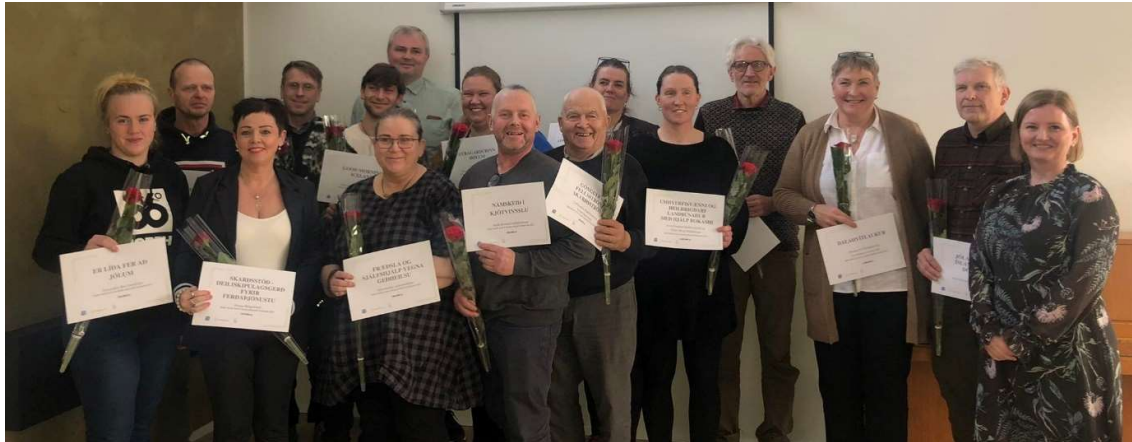
Styrkhafar Frumkvæðissjóðs DalaAuðs árið 2022, ásamt verkefnisstjóra

Tveim verkefnum lauk fyrir lok árs 2022 en það eru verkefni Complete vocal söngnámskeið og jólatónleikarnir Er líða fer að jólum . Nokkur önnur verkefni eru hafin en önnur eru háð því að vera unnin að sumarlagi og hefjast því sumarið 2023.