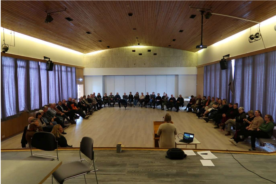
Frá íbúafundi í Dalabyggð, ágúst 2022.

Verkefnisstjórn DalaAuðs fundaði níu sinnum yfir árið, þar af var einn staðfundur vegna undirbúnings á íbúafundi haldinn í ágúst. Þá voru haldnir þrír fundir að auki vegna vinnu við úthlutun úr Frumkvæðissjóði DalaAuðs. Það er að mörgu að huga í fyrsta áfanga verkefnisins og mæðir þá mikið á verkefnisstjórn. Vel tókst til að stilla saman strengi og hópurinn mjög samhentur frá upphafi.