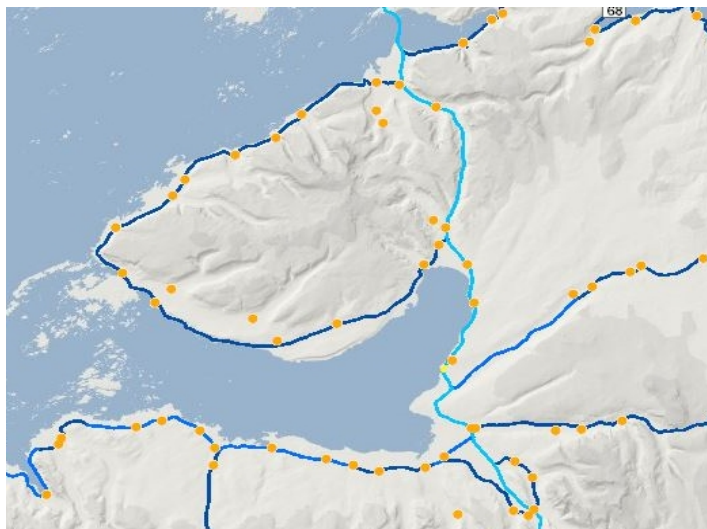
Skjáskot af kortaþekju Vegagerðarinnar þar sem m.a. eru birtar upplýsingar um einbreiðar brýr.

Í vefsjá Vegagerðarinnar má sjá slysatíðni út frá árunum 2017-2021 í kortaþekju. 11 Slysatíðni vegkafla er þar reiknuð út frá fjölda slysa á vegarkafla á milljón ekna kílómetra á ári. Ánægjulegt er að sjá lækkun slysatíðnar á flestum stöðum innan Dalabyggðar frá fyrri gögnum í vefsjónni (2012-2016). Þá var einnig skoðuð kortasjá Samgöngustofu fyrir sl. 6 ár eða tímabilið 01.01.2018 til 31.12.2023. 12 Í heildina hafa orðið 96 slys eða óhöpp innan Dalabyggðar á tímabilinu en til allrar mildi ekkert banaslys.