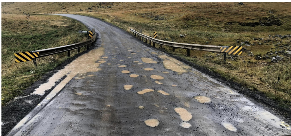
Dæmigert ástand malarvega á blautu hausti, mynd tekin á Skarðsströnd (Klofningsvegi)

Einnig var skoðuð dreifing atvinnurekstrar, þar var bæði stuðst við gögn um fyrirtækjaskráningu og eins var rekstur einyrkja tekinn með í reikninginn. Fyrirvari á fyrirtækjaskráningum er sá að tölur voru frá 2019/2020 og því gætu hafa orðið einhverjar breytingar á. Breytingar voru gerðar þar sem vitað var um t.d. tilfærslu heimilisfanga/flutning og/eða nýjan eða aflagðan rekstur. Niðurstaðan er sú að við langflesta vegakafla í Dalabyggð er að finna atvinnurekstur í einhverri mynd.