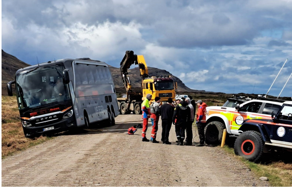
Frá umferðaróhappi á Snæfellsnesvegi (Skógarstrandarvegi), 04.06.2023

Ár hvert gefur Vegagerðin út umferðartölur fyrir mest allt þjóðvegakerfið, þó yfirleitt ekki á héraðsvegum. Þessar umferðartölur eru gefnar upp sem meðaltöl fyrir ákveðna lengd innan hvers vegar m.ö.o. hvert meðaltal gildir bara fyrir ákveðna lengd innan hvers vegar, vegkafla eða stall. Þannig er tiltekin árdagsumferð (ÁDU) þ.e. meðalumferð á dag yfir árið, sumardagsumferð (SDU) þ.e. meðalumferð á dag mánuðina júní - september og vetrardagsumferð (VDU) þ.e. meðalumferð á dag mánuðina janúar - mars og desember. Hægt er að skoða þessar tölur í fyrrnefndri vefsíðu Vegagerðarinnar.