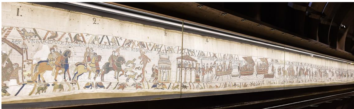
Bayeux refillinn víðfrægi

Reflar eru útsaumsverk, en þeirra þekktarstur er Bayeux refillinn í Normandí í Frakklandi, sem fjallar um landvinninga Vilhjálms bastarðs á Englandi. Hann er um 70 metra langur.