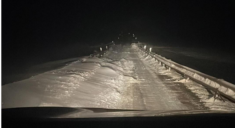
Mynd tekin sl. vetur við einbreiða brú á Laxárdalsheiði.

Dalabyggð er áfram um verkefni stjórnvalda við að fækka einbreiðum brúm og vill benda á að nokkrar brýr í Dalabyggð væri hægt að leggja niður með minni tilkostnaði heldur en að byggja nýja tvíbreiða, þ.e. með því að leggja stálræsi eða svokölluð hálfbogaræsi í staðinn. Má þar nefna eftirfarandi: Á vegi nr. 59, Hólkotsá í Laxárdal, Skeggjagil í Laxárdal, Laxá á Laxárdalsheiði, á vegi nr. 55 Þverá og Hraunholtaá, á vegi nr. 585 Svínhólgil, á nr. 5845 Saurstaðagil, á vegi nr. 593 Helluá, vegur nr. 590 Nípurá, á vegi nr. 690 Kleifaá og á vegi nr. 587 Ljá.