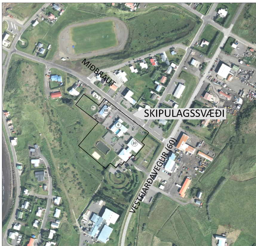
Mynd 1 Afmörkun deiliskipulags fyrir Auðarskóla og íþróttamiðstöð í Búðardal.

Næsta veðurathugunarstöð í Búðardal er í Ásgarði en þar er sjálfvirk veðurathugunarstöð. Mönnuð úrkomustöð er á Kvinnabrekku í Dölum. Í Ásgarði er norðan og norðnorðaustanátt algengasta vindáttin og jafnframt algengasta hvasviðrisáttin (Mynd 2). Meðaltal ársúrkoma árána 2010-2019 í Ásgarði er 774 mm og 570 mm í Kvinnabrekku. Þessi litla ársúrkoma