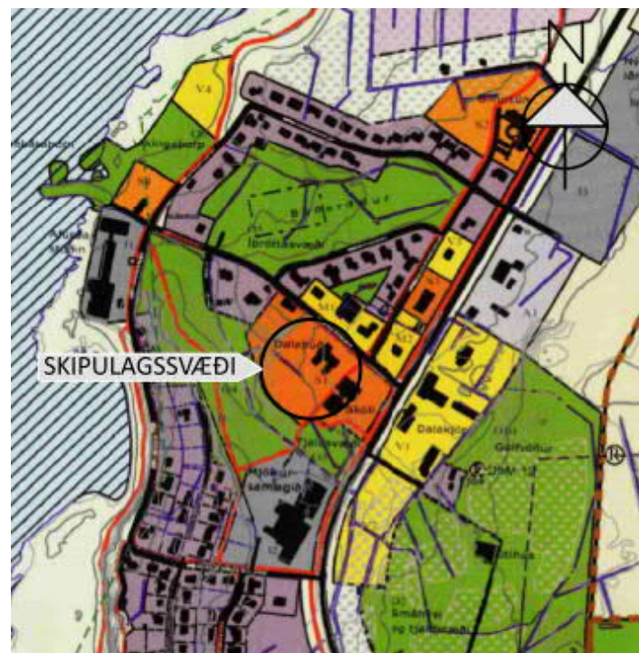
Mynd 3 Aðalskipulag Dalabyggðar 2004-2016, Búðardalur – þéttbýli.

Gildandi Aðalskipulag Dalabyggðar 2004-2016 tók gildi árið 2009. Aðalskipulagið var unnið samkvæmt þágildandi skipulags- og byggingarlögum. Í gildandi aðalskipulagi er svæðið skilgreint sem svæði fyrir þjónustustofnanir í þéttbýli, en markmið fyrir þjónustustofnanir er að „Grunnskóla- og leikskólalóðir verði í góðum tengslum við íbúðahverfi og nýtast þannig sem útivistarsvæði. Stuðlað verði að aukinni þjónustu (hjúkrunardeild) við dvalarheimilið í Silfurtúni og styrkingu á stöðu Heilsugæslustöðvarinnar. Félagsleg þjónusta verði sem mest miðsvæðis og aðgengileg öllum íbúum“. Á skipulagsupprætti (Mynd 3) fellur skipulagssvæðið undir „S1 - Grunnskólinn í Búðardal“. Þar segir: „Starfsemi Grunnskóla Dalabyggðar er á um 2,9 ha lóð við Miðbraut. Svæðið nær einnig yfir lóð Dalabúðar sem hefur í vaxandi mæli verið nýtt í þágu skólastarfs. Leikskólinn í Búðardal nýtir einnig aðstöðu í skólanum.“