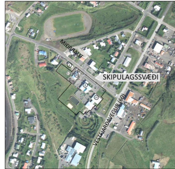
AÐALSKIPULAG DALABYGGÐAR 2004-2016. MKV. 1:10.000