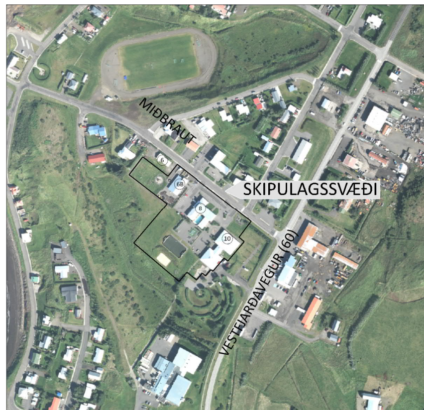
Mynd 1 Afmörkun deiliskipulags fyrir Auðarskóla og íþróttamiðstöð í Búðardal. Kortagrunnur Loftmynda.

Skipulagssvæðið er á sléttu landi en hallar lítið eitt frá götu. Vestur af því hallar niður að ströndinni. Norðan og austan svæðisins eru byggð svæði, en óbyggt opið svæði er aðliggjandi til suðvesturs og vesturs. Svæðið og umhverfi þess er almennt vel gróið gras- og mólendi, þ.e. það sem er ekki þegar byggt.