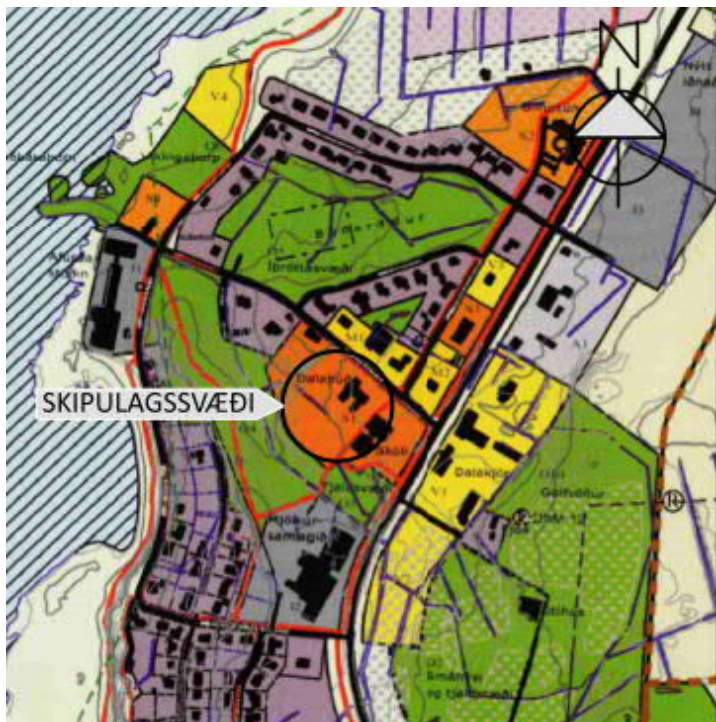
Mynd 3 Aðalskipulag Dalabyggðar 2004-2016, Búðardalur – þéttbýli.