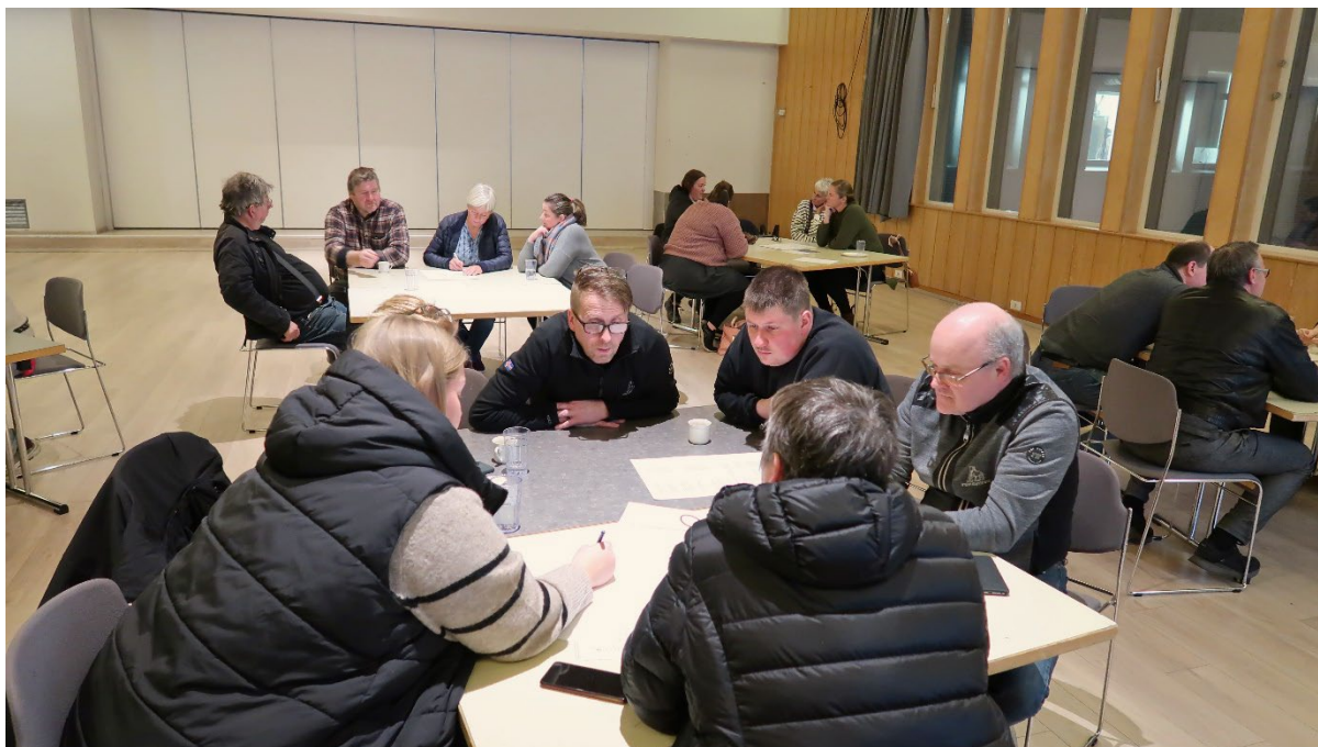
Umræður á íbúafundi 2023. KPH.

Verkefnisáætlun Dalauðs er eins og áður segir verkefnabanki með tímasettum markmiðum. Þar eru tæplega 60 verkefni (starfsmarkmið) á dagskrá, sum stór en önnur smá, sum til skemmri tíma og önnur til lengri. Tæplega helmingur þessara verkefna voru á dagskrá árið 2023 og þurfti að endurskoða tímasetningar nokkurra og færa þau aftur og var það samþykkt ásamt öðrum breytingum á verkefnisáætlun á íbúafundi í nóvember 2023. Ánægjulegt var hve umræðurnar á íbúafundi voru gagnlegar og góðar. Efnislega hélst verkefnisáætlunin að mestu óbreytt en bætt var við nokkrum nýjum aðgerðum á meðan að einstaka aðgerðir eða markmið voru felld niður eða orðalagi breytt lítillega. Nánar verður sagt frá stöðu einstakra markmiða og breytingum í næsta kafla.