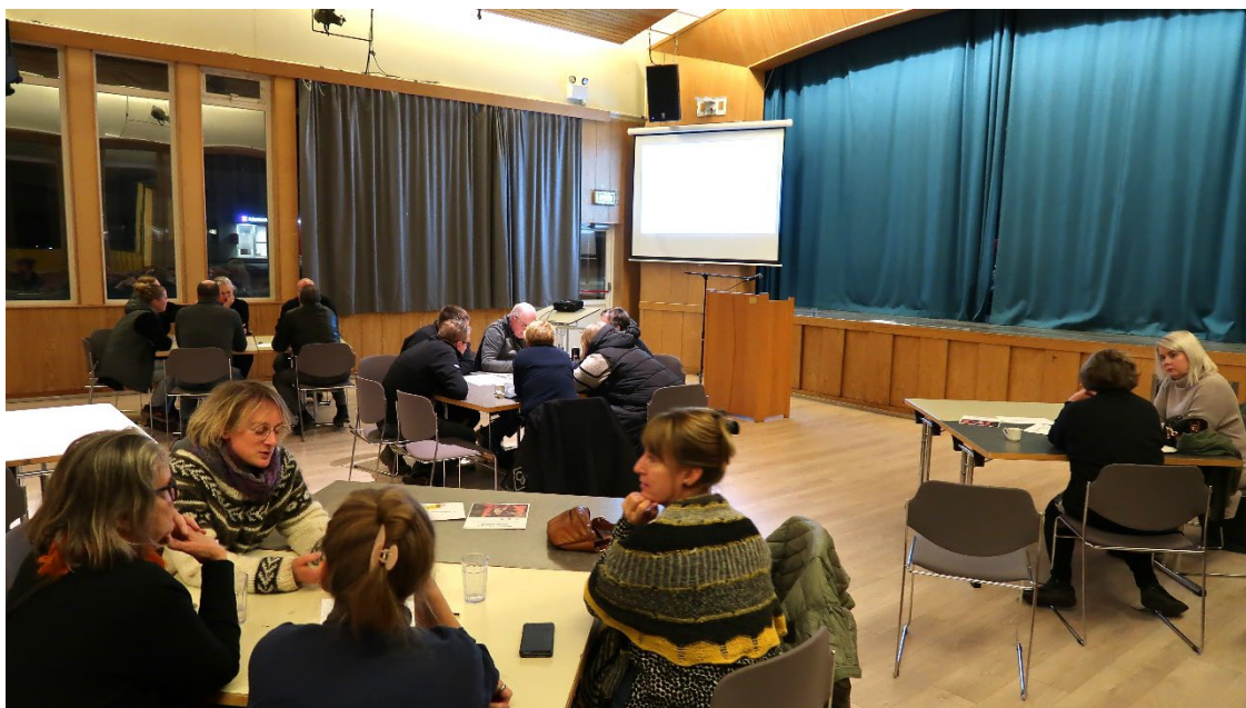
Af íbúafundi í nóvember 2023.