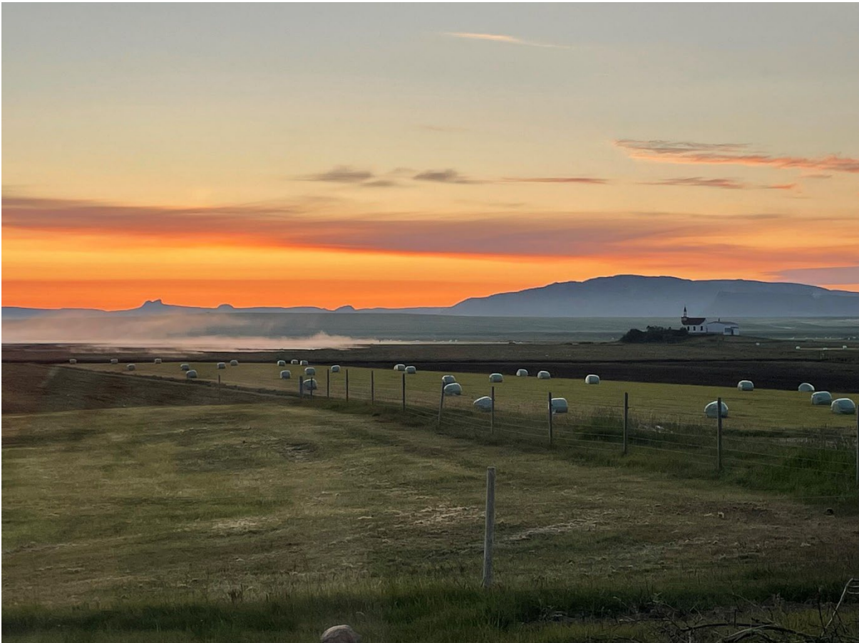
Saurbær í Dalabyggð

Það er gróska í Dalabyggð. Fólk talar um það og fleiri hafa orð á því að Dalabyggð er að verða meira áberandi út á við. Ánægjulegt hefur verið að fylgjast með framgangi verkefna, bæði þeirra sem hafa fengið nýsköpunarstyrki og þeirra sem hafa verið settir á laggirnar óháð þeim. Félagslífið er kröftugt og mannlífið er að blómstra, það sést í fjölbreyttu viðburðarhaldi ýmis konar á árinu. Íbúar eru margir hverjir farnir að kannast við nýsköpunarsetrið og eru duglegir að sækja það sem þar er í boði, bæði vinnuáðstöðuna, fundi, fræðslu og erindi.