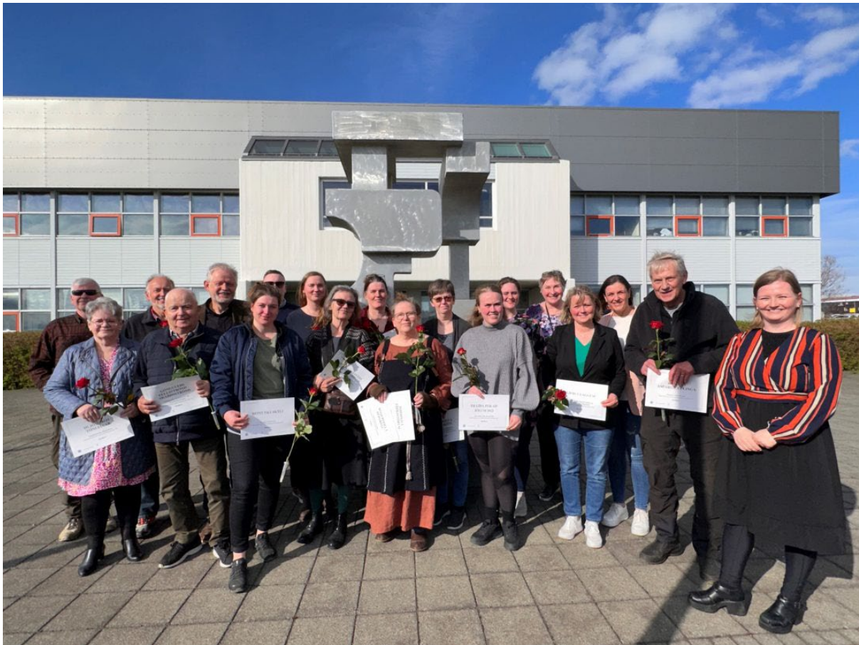
Styrkþegar Frumkvæðissjóðs DalaAuðs árið 2023, ásamt verkefnisstjóra.

Viðvera verkefnisstjóra hefur verið sú sama en hún vinnur alla virka daga, að jafnaði 4 daga í viku í Nýsköpunarsetrinu í Búðardal og 1 dag í viku á heimaskrifstofu í Saurbænum. Nú eru flestir farnir að kannast við verkefnisstjóran og fólk almennt óhrætt við að kíkja við, fá ráðgjöf eða ræða málin, sem er afar jákvætt. Heldur jókst að fólk sótti almenna ráðgjöf óháð Frumkvæðissjóðinum sem er einnig ánægjulegt. Umsækjendur og styrkþegar Frumkvæðissjóðsins hafa almennt verið mjög dugleg að nýta þjónustu verkefnisstjóra, hvort sem er við umsóknarferlið, framvinduna eða lokaskýrslugerð.