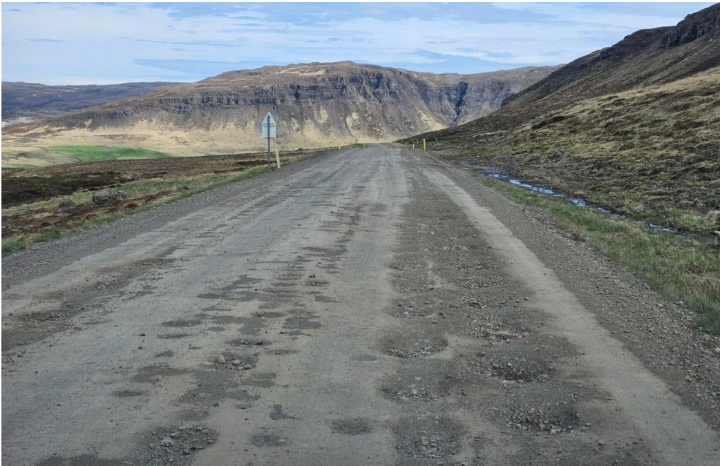
Mynd tekin rétt hjá Narfeyri á Snæfellsnesvegi (nr. 54)

Af þessum 18 köflum undir vegum með tveggja stafa númer eru aðeins 11 sem eru slitlagðir að fullu, 3 sem eru með slitlag að hluta til (þá við lögbýli á leiðinni) og 3 sem eru án alls slitlags. Þess má geta að verið er að vinna í einum af þessum köflum, þ.e. framkvæmdir við Snæfellsveg/Skógarströnd sem áður hafa verið nefndar. Þegar skoðaðir eru vegir með þriggja stafa númer minnkar hlutfall slitlags, þar er aðeins einn vegkaflí sem hefur slitlag að fullu, fjórir sem hafa bæði (s.s. slitlag við bæi) en 14 sem enn eru aðeins malarvegir. Hlutfall slitlags er svo enn minna þegar skoðaðir eru vegir með fjögurra stafa númer. Það ber að athuga að slitlag í þessum skilningi er ekki endilega í fullri breidd.