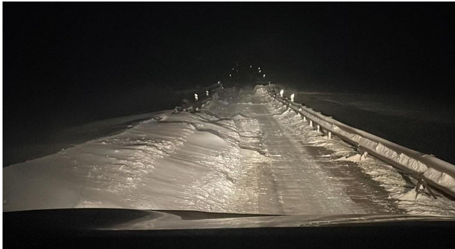
Mynd tekin sl. vetur við einbreiða brú á Laxárdalsheiði.

Dalabyggð er áfram um verkefni stjórnvalda við að fækka einbreiðum brúm og vill benda á að nokkrar brýr í Dalabyggð væri hægt að leggja niður með minni tilkostnaði heldur en að byggja nýja tvíbreiða, þ.e. með því að leggja stálræsi eða svokölluð hálfbogaráesi í staðinn. Má þar nefna eftirfarandi: Á vegi nr. 59, Hólkotsá í Laxárdal, Skeggjagil í Laxárdal, Laxá á Laxárdalsheiði, á vegi nr. 55 Þverá og Hraunholtaá, á vegi nr. 585 Svínhólsgil, á nr. 5845 Saurstaðagil, á vegi nr. 593 Helluá, vegur nr. 590 Nípurá, á vegi nr. 690 Kleifaá og á vegi nr. 587 Ljá.