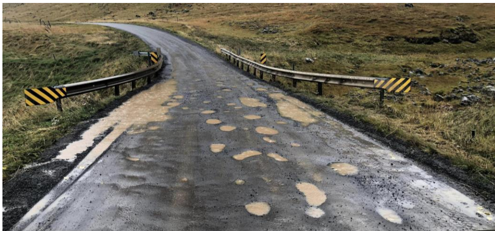
Dæmigert ástand malarvega á blautu hausti, mynd tekin á Skarðsströnd (Klofningsvegi)

Einnig var skoðuð dreifing atvinnurekstrar, þar var bæði stuðst við gögn um fyrirtækjaskráningu og eins var rekstur einyrkja tekinn með í reikninginn. Fyrirvari á fyrirtækjaskráningum er sá að tölur voru frá 2019/2020 og því gætu hafa orðið einhverjar breytingar á. Breytingar voru gerðar þar sem vitað var um t.d. tilfærslu heimilisfanga/flutning og/eða nýjan eða aflagðan rekstur. Niðurstaðan er sú að við langflesta vegakafla í Dalabyggð er að finna atvinnurekstur í einhverri mynd.