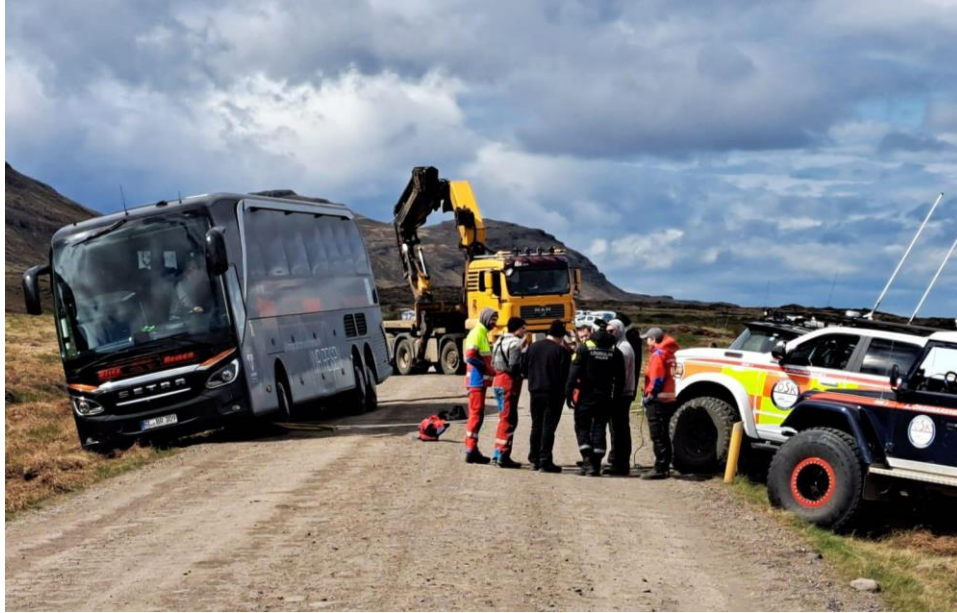
Frá umferðaróhappi á Snæfellsnesvegi (Skógarstrandarvegi), 04.06.2023

Ár hvert gefur Vegagerðin út umferðartölur fyrir mest allt þjóðvegakerfið, þó yfirleitt ekki á héraðsvegum. Þessar umferðartölur eru gefnar upp sem meðaltöl fyrir ákveðna lengd innan hvers vegar m.ö.o. hvert meðaltal gildir bara fyrir ákveðna lengd innan hvers vegar, vegkafla eða stall. Þannig er tiltekin árdagsumferð (ÁDU) þ.e. meðalumferð á dag yfir árið, sumardagsumferð (SDU) þ.e. meðalumferð á dag mánuðina júní - september og vetrardagsumferð (VDU) þ.e. meðalumferð á dag mánuðina janúar - mars og desember. Hægt er að skoða þessar tölur í fyrrnefndri vefsíðu Vegagerðarinnar.